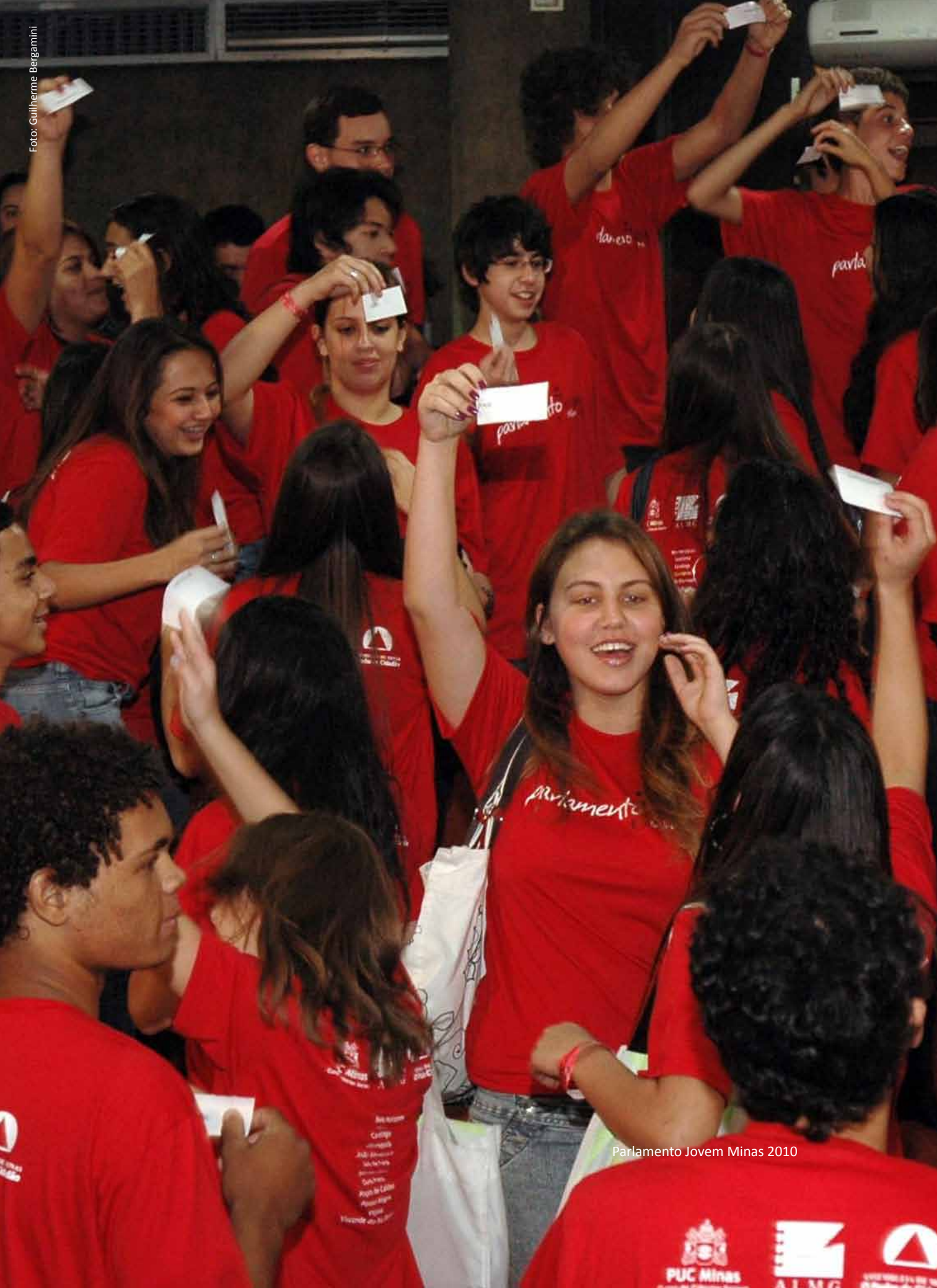
Parlamento Jovem Minas 2010