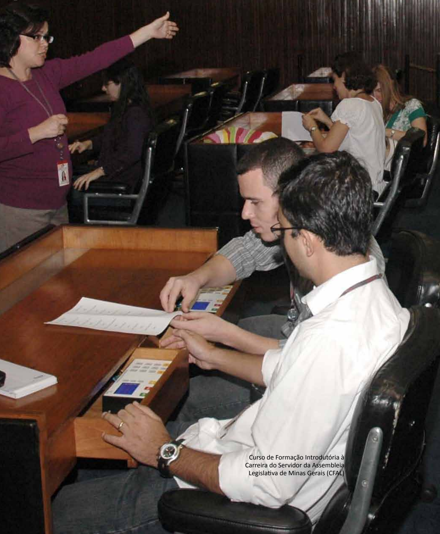
Curso de Formação Introdutória à Carreira do Servidor da Assembleia Legislativa de Minas Gerais (CFAL)