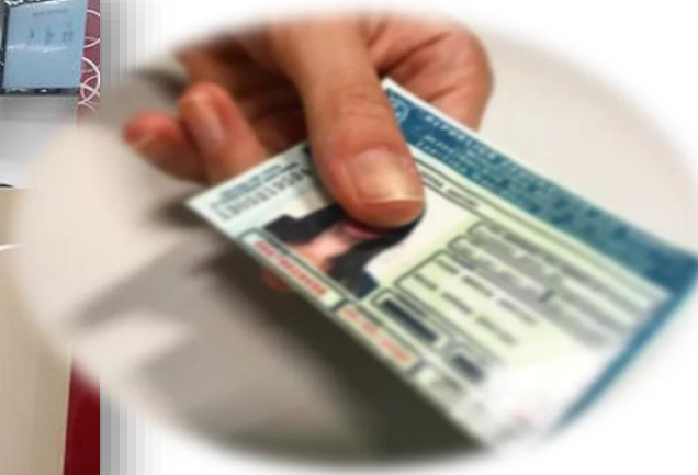
Simplificação do serviço de renovação da CNH nas UAIs