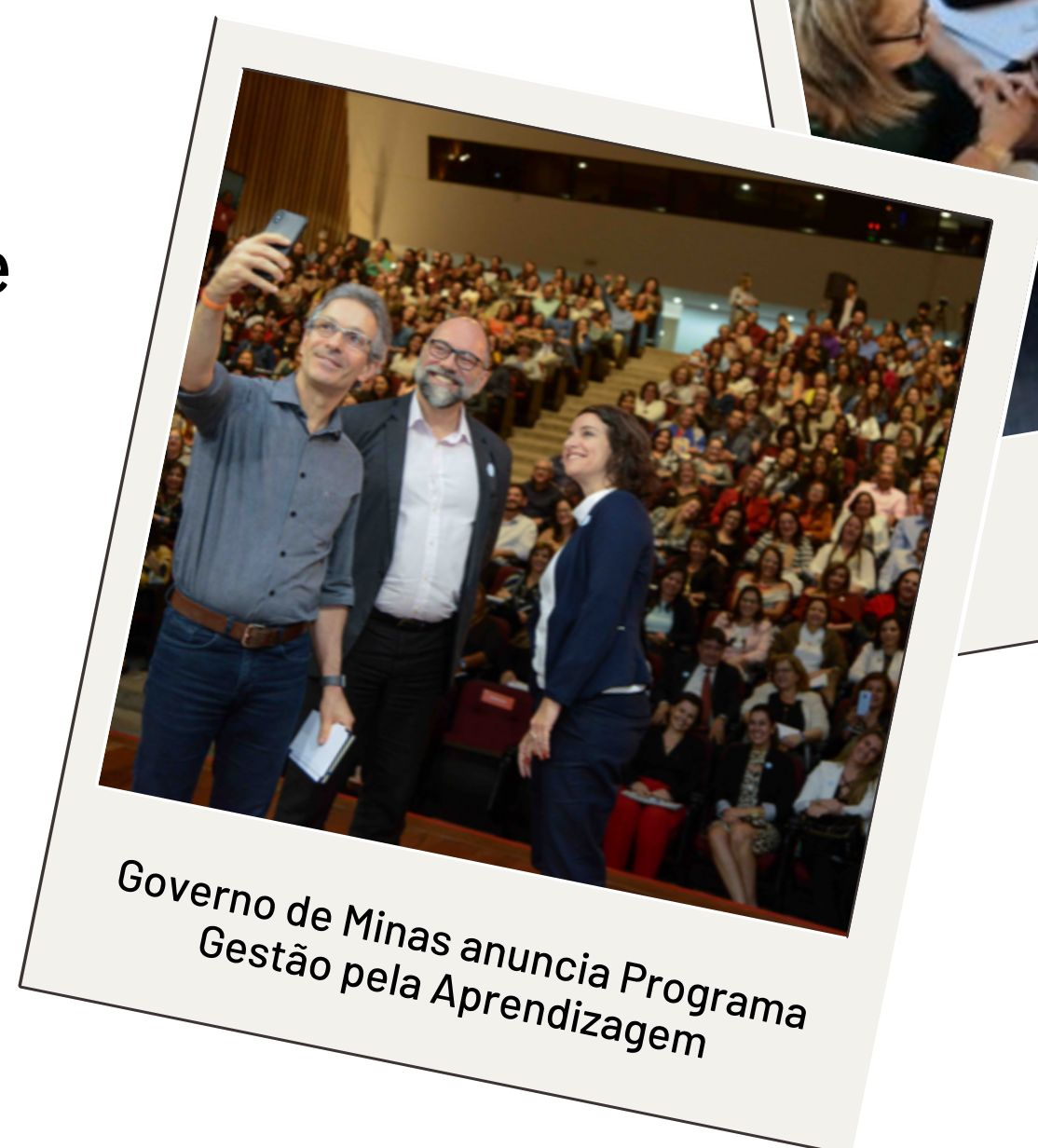
Governo de Minas anuncia Programa Gestão pela Aprendizagem